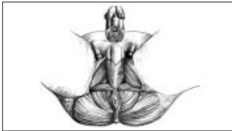
Zeichnung I: Der Beckenboden.

Um den Orgasmus hinauszuzögern, müssen Sie die Beckenbodenmuskeln, insbesondere die ischiocavernöse Muskulatur oder IC-Muskulatur («Potenzmuskulatur») kennen lernen (Zeichnung I). Haben Sie keine Hemmungen, diese Muskeln anzufassen, um während des Trainings ihre Aktivierung und Veränderung spüren zu können. Legen Sie die Hände einfach auf die verschiedenen Muskeln.